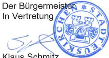
Klaus Schmitz Stadtkämmerer