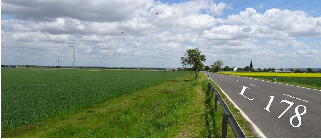
Abbildung 6: Landschaftsbild nördlich des Plangebietes (LANDSCHAFT!, Mai 2021)

Erst in größerer Entfernung erscheinen in südlicher Richtung die bewaldeten Kuppen der Voreifel.