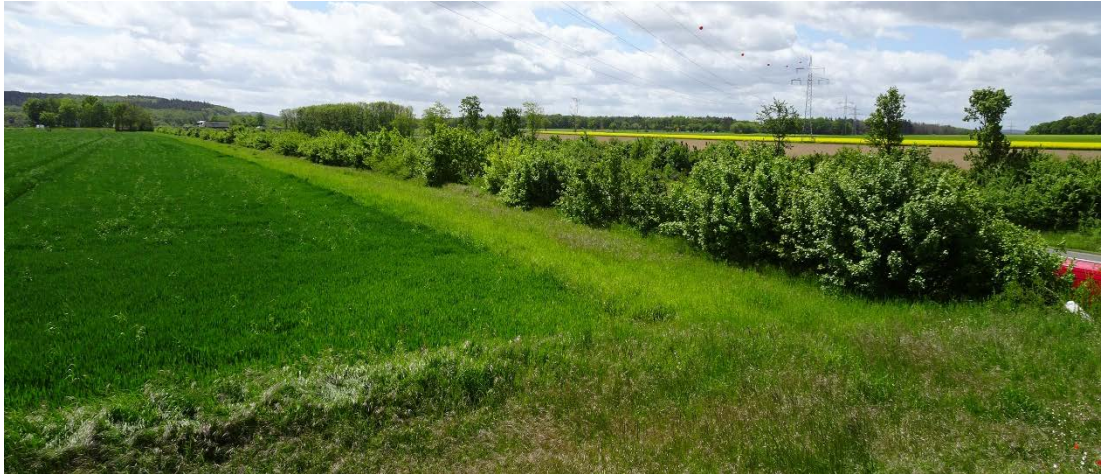
Abbildung 3: Böschung der BAB A1 mit Strauchbestand (LANDSCHAFT!, Mai 2021)