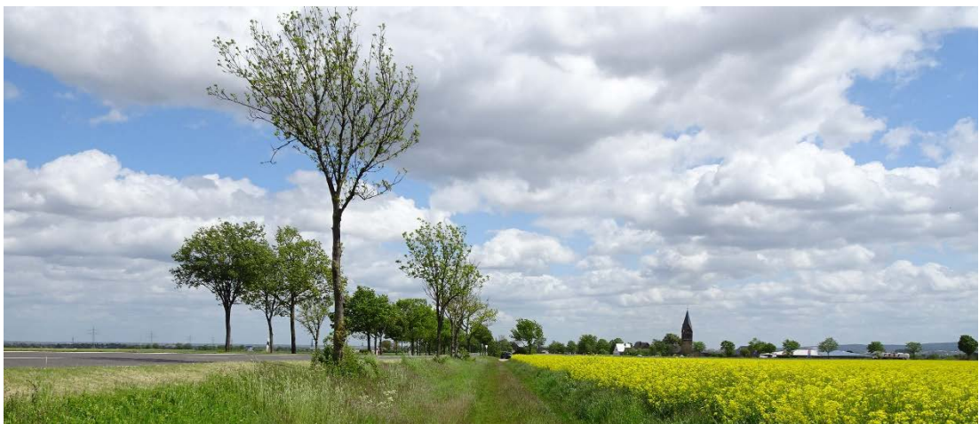
Abbildung 4: Straßenbäume entlang der L 178 (LANDSCHAFT!, Mai 2021)