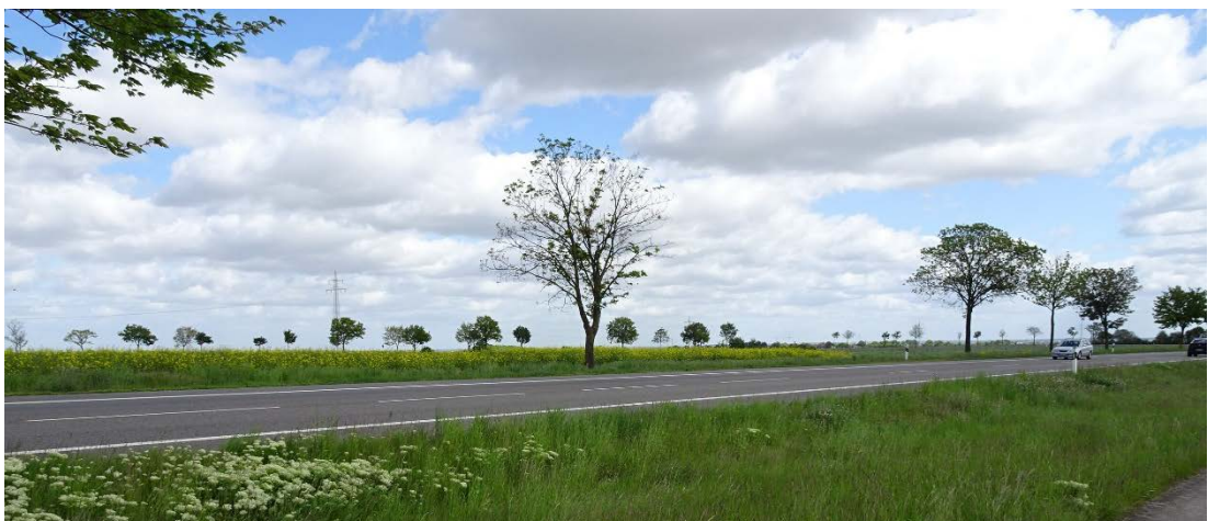
Abbildung 5: Straßenbäume entlang der B 266 (LANDSCHAFT!, Mai 2021)

Seltene oder besonders geschützte Pflanzenarten gem. § 42 Landesnaturschutzgesetz (LNatSchG) NRW [viii] kommen nach den vorliegenden Unterlagen im Untersuchungsraum nicht vor.