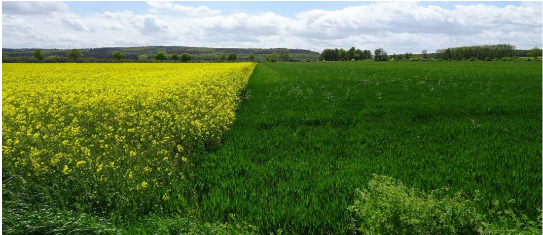
Abbildung 7: Blick über das Plangebiet Richtung Süden (Voreifel) (LANDSCHAFT!, Mai 2021)

Erst in größerer Entfernung erscheinen in südlicher Richtung die bewaldeten Kuppen der Voreifel.