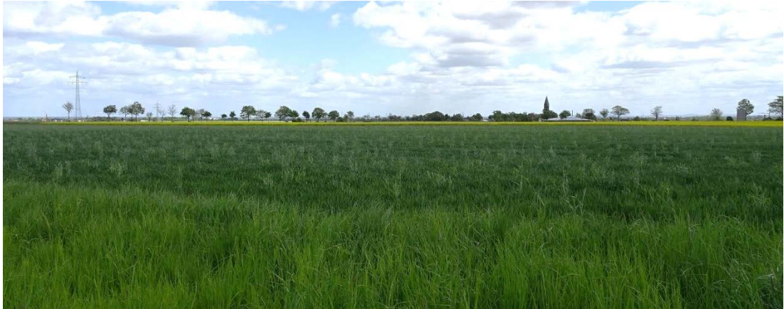
Abbildung 1: Überblick über das Plangebiet von West Richtung Ost

Das Plangebiet wird intensiv landwirtschaftlich genutzt, der Großteil als Acker, ca. \frac{1}{4} als Grünland. An den Rändern des Plangebietes kommen Ackerrandstreifen, Wegraine und Grünlandbrachen vor.