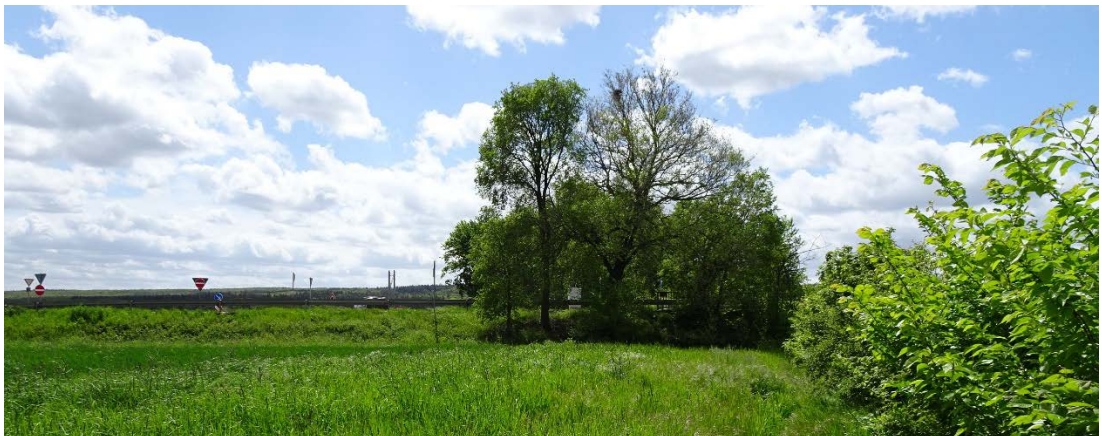
Abbildung 2: Baumgruppe nördlich der Anschlussstelle der BAB A1 (LANDSCHAFT!, Mai 2021)

Nördlich der BAB-Anschlussstelle steht eine Baumgruppe am Rande außerhalb des Plangebietes (s. Abbildung 2).