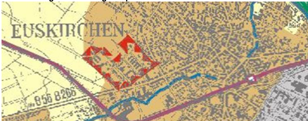
Abb.: Auszug aus dem Regionalplan

Der Regionalplan für den Regierungsbezirk Köln, Teilabschnitt Region Aachen stellt den Planbereich als Allgemeinen Siedlungsbereich (ASB) dar.