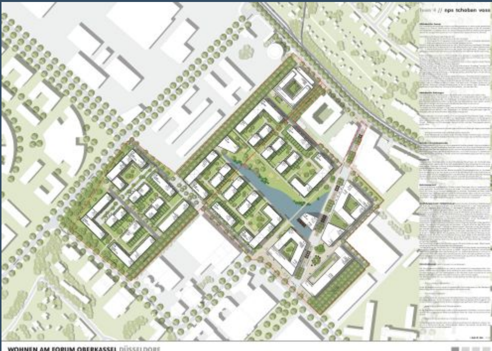
B-Plan-Vorentwurf Nr. 5078/029