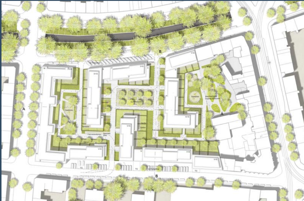
Bebauungsplan-Vorentwurf Nr. 5474/059