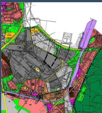
Bisherige Darstellung Flächennutzungsplanänderung Nr. 112 (Vorentwurf)