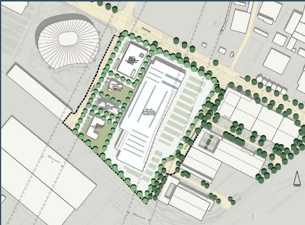
Bebauungsplan-Vorentwurf Nr. 5682/012