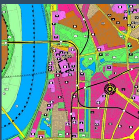
Bisherige Darstellung Flächennutzungsplanänderung Nr. 149 (Vorentwurf)