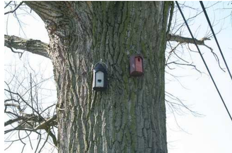
Foto 4: Pos. 2 - Fledermaus- bzw. Nistkasten - 2 u. 3 - Fledermaushöhle 2F (universell), Nisthöhle 1B "oval".