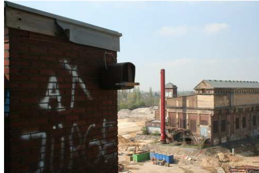
Foto 11: Pos. 8 - Nistkasten - 5 – Turmfalkennisthöhle Typ Nr. 28.