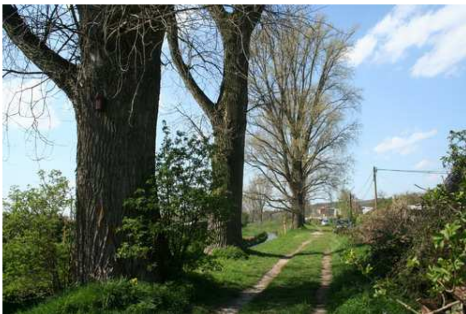
Foto 2: Hybridpappeln an der nördlichen Düssel mit Vogel- und Fledermauskästen.

Mit Auftrag vom 19.01.2014 wurde das Büro des Verfassers von der PATRIZIA Deutschland GmbH mit der Exposition von 17 Nist- und Fledermauskästen im Umfeld der Baumaßnahme „Glasmacherviertel“ in Düsseldorf-Gerresheim beauftragt. Die Kästen sind unabhängig möglicher weiterer Auflagen der zuständigen ULB der Stadt Düsseldorf, als präventiver Ersatz für die im Rahmen der Baumaßnahmen entfallenden Gehölze mit Baumhöhlen (Spechthöhlen, Faullöcher und Risse) aber auch für den Verlust möglicher Gebäudequartiere und Brutplätze vorgesehen (HENF & MÖNIG 2013 u. 2015). Sie dienen als CEF-Maßnahme 1 für eine potenzielle Beseitigung von Fortpflanzungs- oder Ruhestätten der wild lebenden Tiere der besonders geschützten Arten (vgl. BNatSchG § 44) (DER BUNDESMINISTER FÜR NATUR, UMWELT UND REAKTORSICHERHEIT 2009).