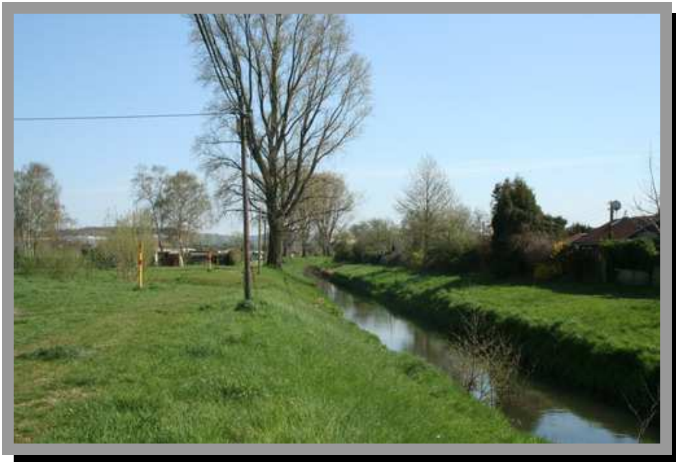
Foto 1: Expositionsbereich für Fledermaus- und Vogelkästen an der nördlichen Düssel.

MANFRED HENF BÜRO FÜR ÖKOLOGIE, KARTIERUNGEN UND FLÄCHENBEWERTUNGEN APRIL 2015