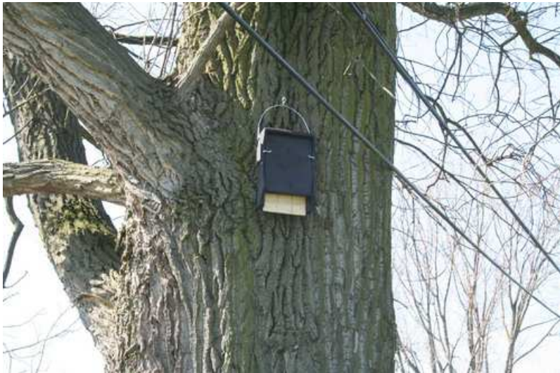
Foto 3: Pos. 1 - Fledermauskasten - 1 – Fledermausflachkasten 1FF.