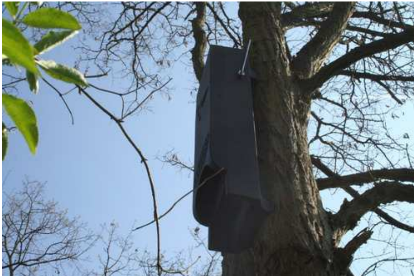
Foto 9: Pos. 7 - Fledermauskasten - 10 – Fledermaus-Universalhöhle 1FFH.