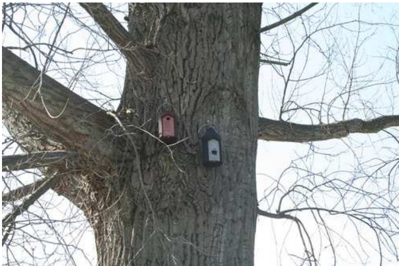
Foto 5: Pos. 3 - Fledermaus- bzw. Nistkasten - 4 u. 5 - Fledermaushöhle 2F (universell), Nisthöhle 1B Ø 32mm.