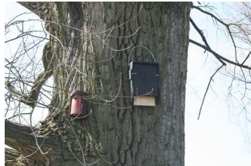
Foto 6: Pos. 4 - Fledermaus- bzw. Vogelkasten - 6 u. 7 - Nisthöhle 1B Ø 26mm, Fledermausflachkasten 1FF.