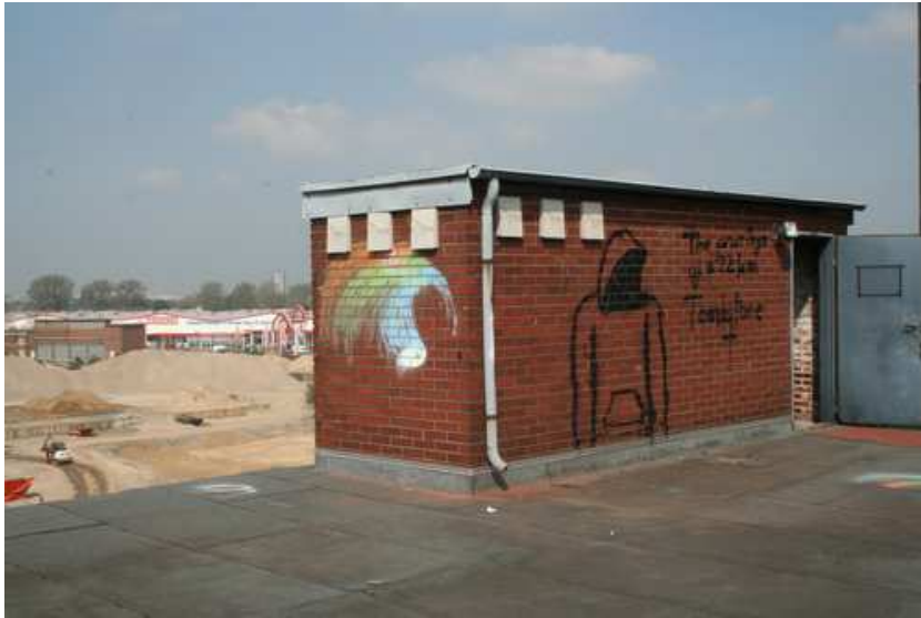
Foto 10: Pos. 8 - Fledermausquartier - 11-16 – Fledermauswandschale 2FE.