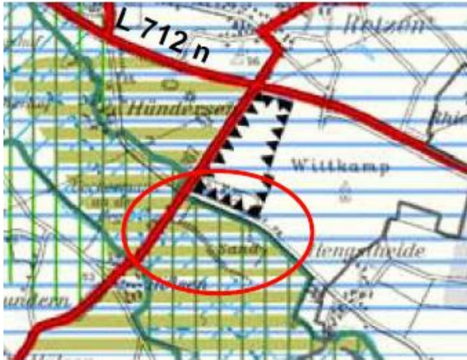
Abb. 2: Auszug aus dem Regionalplan