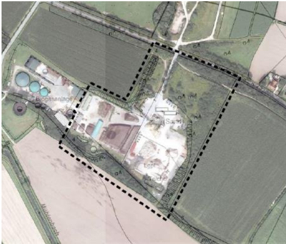
Abb. 1: Luftbild mit Geltungsbereich